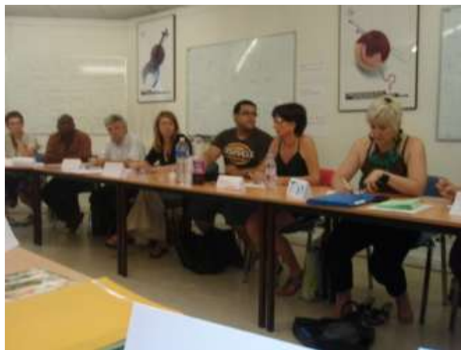
Session juillet 2010 au Centre Ressources à EVRY

Quel formidable inter-réseaux elles constituent puisque se sont retrouvés les animateurs de formation des R.E.R.S.suivants : AGON-COUTAINVILLE (50) - BAR-LE-DUC (55) - CHELLES (77) - ETAMPES (91) - EVRY (91) - GRENOBLE (38) - LISIEUX (14) - LORIOLE (26) - MEAUX (77) -