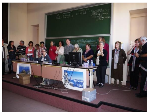
L'équipe organisatrice de l'AG (Inter-réseaux de Midi-Pyrénées)