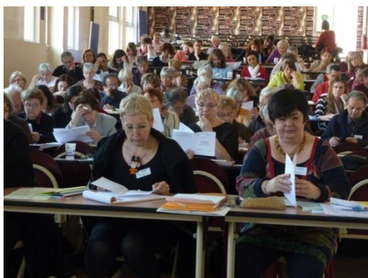
Une séance plénière