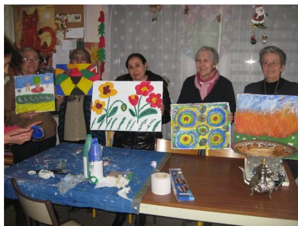
Le Lien Inter - Réseaux

On ressentait une sorte de quiétude, parce qu'on était toutes en train de créer quelque chose qui sortait de nous et que ces images parlent et valent plus que 1000 mots ne pourront le faire. »