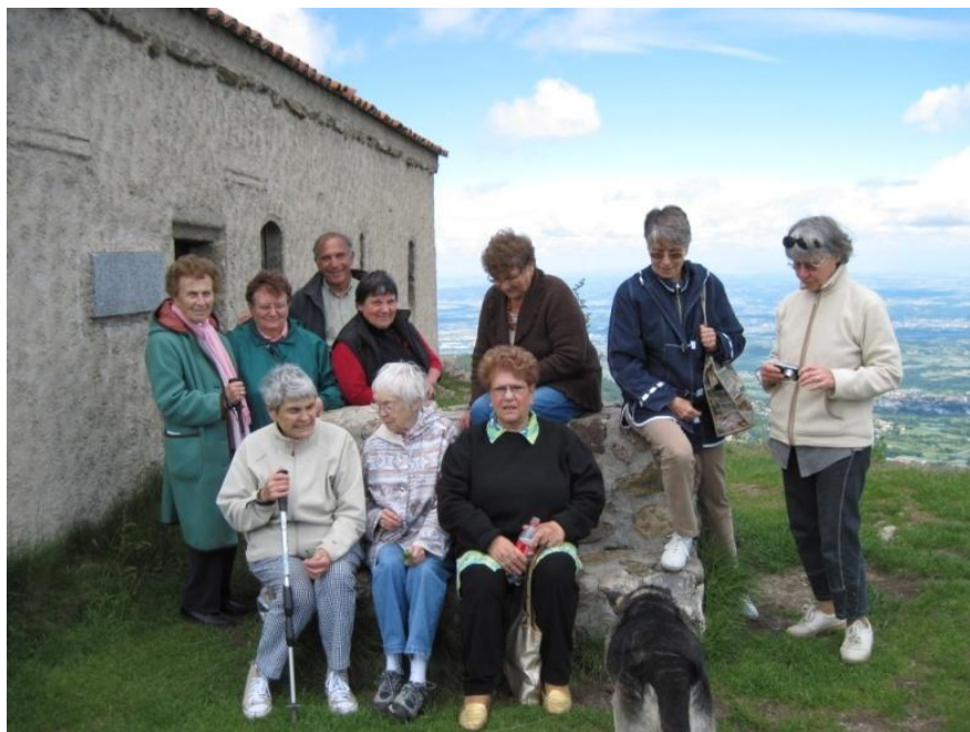
Promenade vers la chapelle St-Sabin dans le massif du Pilat"

Notre « Réseau » a fêté ses 20 ans d'existence en 2012.