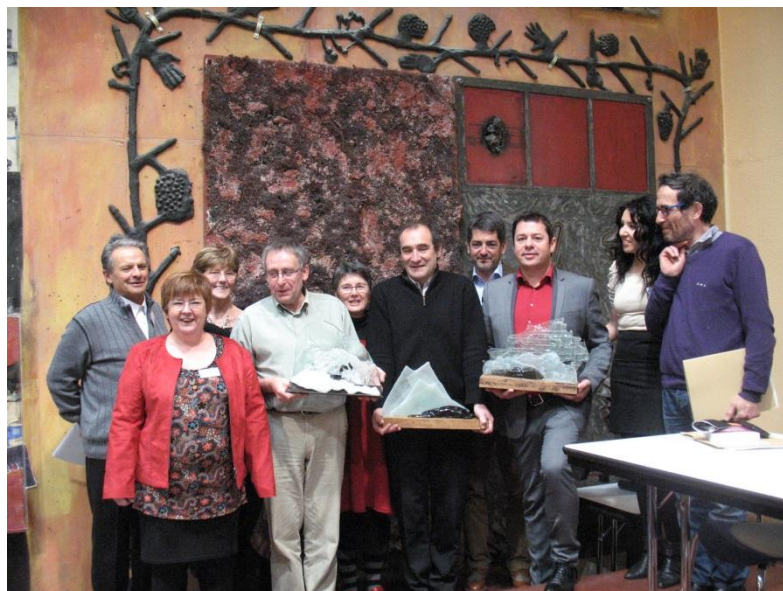
Les trois lauréats tenant en main leurs trophées réalisés par l'artiste Jipé BOCQUEL, du réseau d'Arpajon

Les trois lauréats ont écrit un ouvrage collectif : « Handicap, reconnaissance et formation tout au long de la vie »**.