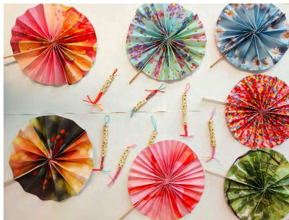
Echanges arts plastiques pendant l'été Canicule : on a décidé de fabriquer des éventails

Espace Centre-Ville - 38 allée Jean Rostand 01 64 97 09 38 de 10h à 13h et de 14h à 19h Espace Le Canal - 1 place du Printemps 01 69 36 94 11 de 10h à 13h et de 14h à 18h Espace Pyramides - 402 ter square Jacques Prévert 09 79 73 45 77 de 10h à 13h et de 14h à 18h